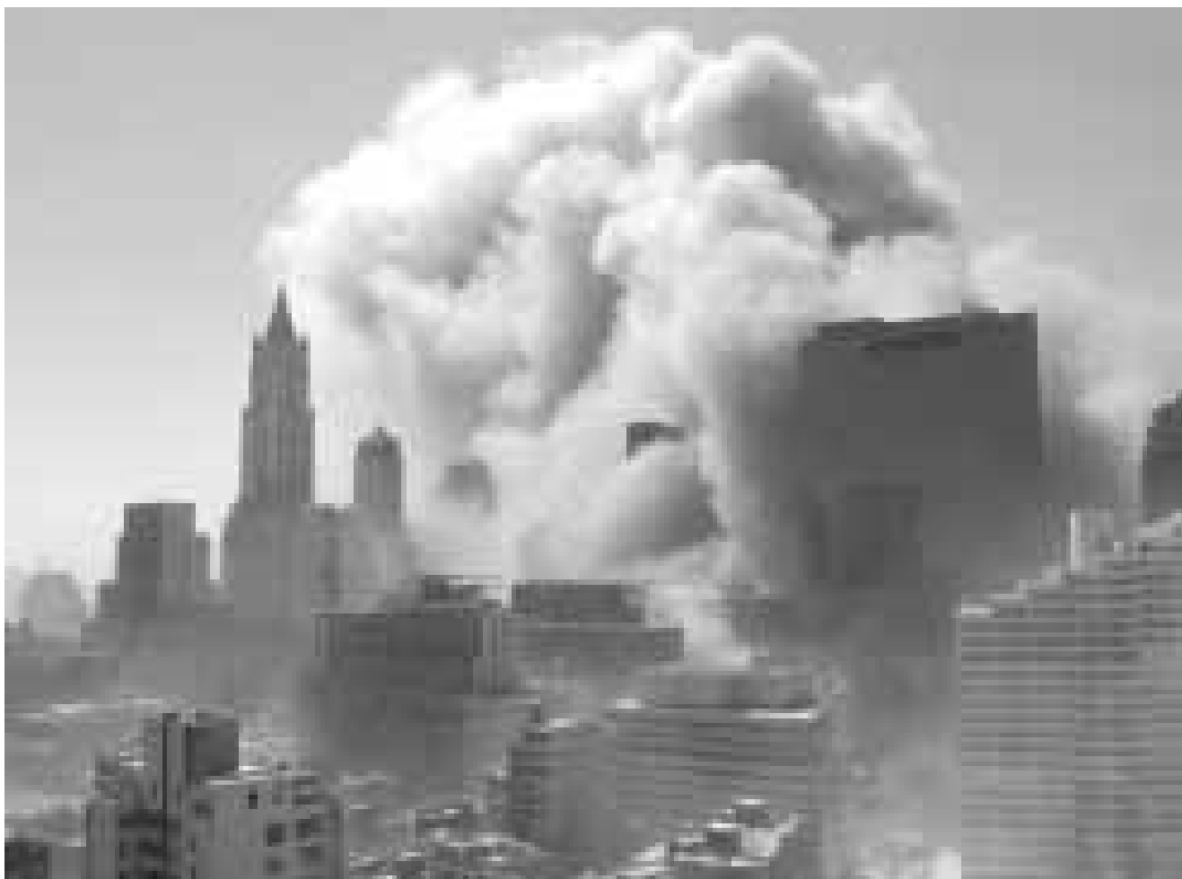
دخان يتصاعد من مبنى مركز التجارة بعد انهيار برجيه