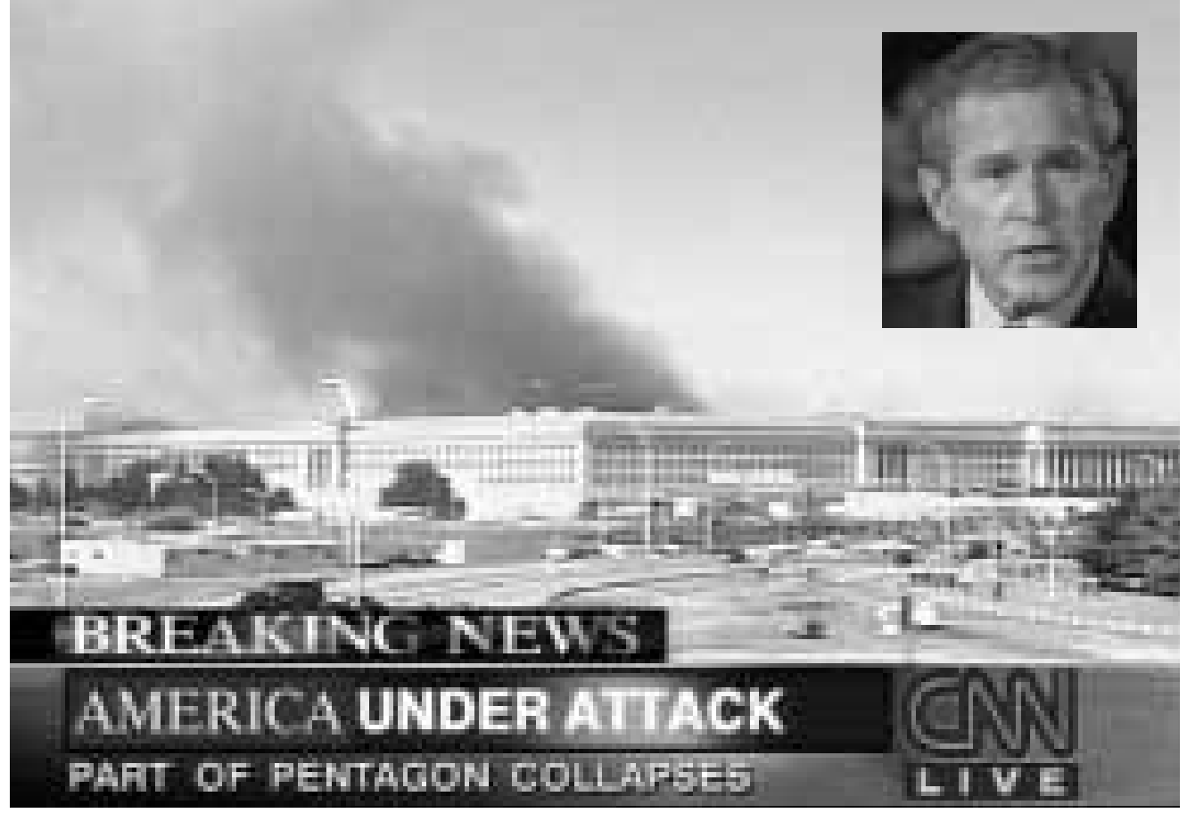
صورة بثتها «سي إن إن» لبني وزارة الدفاع وفي الاطار الرئيس بوش (أف ب، رويترز)

هاجمت ٣٥٣ طائرة يابانية هاواي في السابع من كانون الأول (ديسمبر) ١٩٤١ في الحرب العالمية الثانية، وأسفر الهجوم عن مقتل ٢٢٤١ جندياً أميركياً و٤٤ مدنياً وجرح ٣٤٨٤ جندياً و٣٥ مدنياً. كما أدى إلى تدمير وغرق ١٢ سفينة حربية أميركية وإلحاق اضرار بتسع سفن أخرى، وتدمير ١٦٤ طائرة حربية وإلحاق اضرار بـ ١٥٩ طائرة. وأدى الهجوم الياباني المفاجئ إلى إعلان الولايات المتحدة الحرب على اليابان ودخولها الحرب العالمية الثانية. وألقت الولايات المتحدة قنبلتين ذريتين على هيروشيما والناغازاكي في التاسع من الشهر نفسه عام ١٩٤٥ ما أوقع من الألاف من القتلى والجرحى والشوهدين.