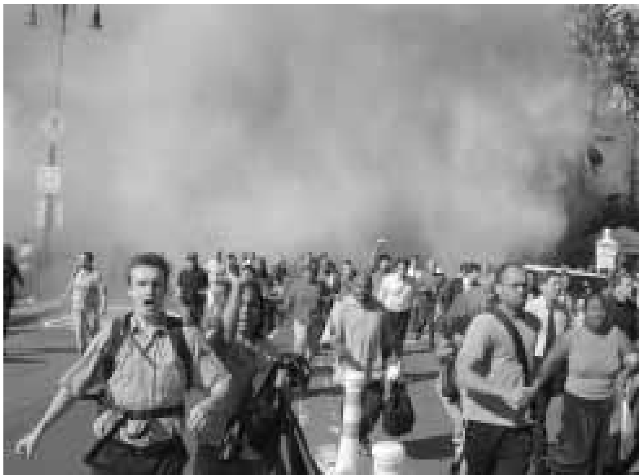
الذعر في محيط المبنى